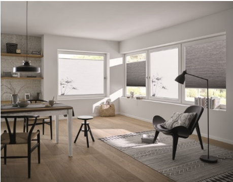
Wabenplissee-Delion mit der Ausgleichsvorrichtung von MHZ.

Die Plissee-Anlagen von MHZ werden mit der Ausgleichsvorrichtung bereits vorgespannt geliefert und können bei Bedarf nach der Montage nachjustiert werden.